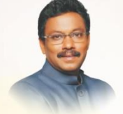
श्री. विनोद तावडे मा. मंत्री सांस्कृतिक कार्य

सोनोपंत दांडेकर कला व वाणिज्य महाविद्यालय, पालघर यांच्या संयुक्त विद्यमाने आयोजित