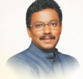
श्री. विनोद तावडे मा. मंत्री सांस्कृतिक कार्य