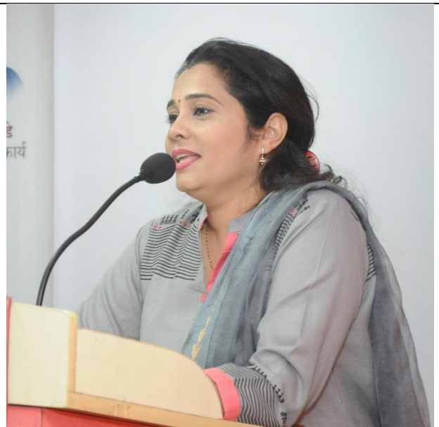
Guidance Famous Poetess Reshma Kapadnis