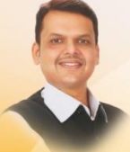
श्री. देवेंद्र फडणवीस मा. मुख्यमंत्री