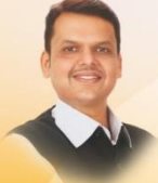
श्री. देवेन्द्र फडणवीस मा. मुख्यमंत्री