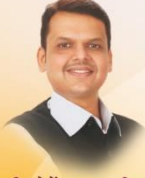
श्री. देवेंद्र फडणवीस मा. मुख्यमंत्री