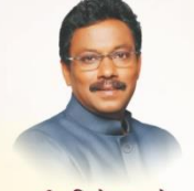
श्री. विनोद तावडे मा. मंत्री सांस्कृतिक कार्य

सोनोपंत दांडेकर कला व वाणिज्य महाविद्यालय, पालघर यांच्या संयुक्त विद्यमाने आयोजित